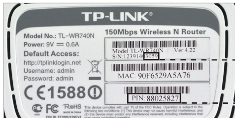
Unterseite des Routers / Bottom side of the router / Dessous du routeur